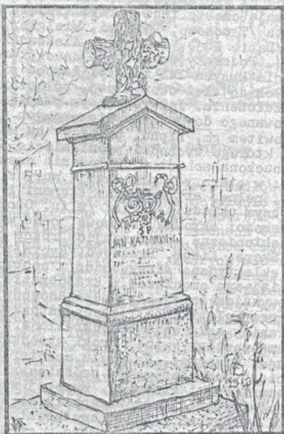
CMENTARZ W DZIAKYNIU /RYS. D. PIOTROWSKI/