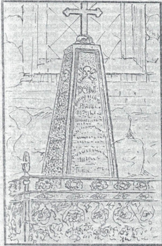
CMENTARZ W RÓGOWIE