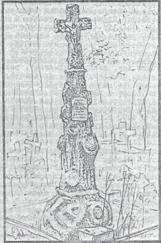
CMENTARZ W SKRWILNIE