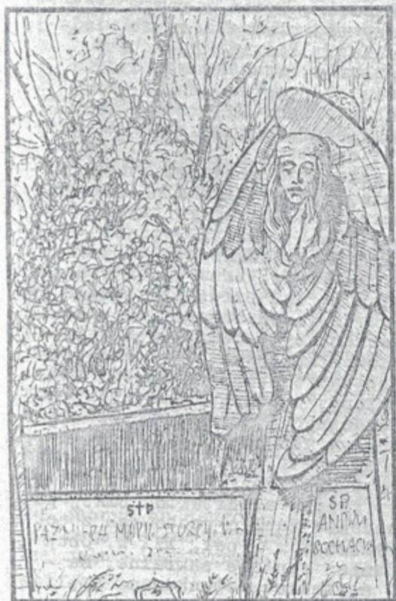
CMENTARZ WE WŁOCŁAWKU

Początki powstawania cmentarzy o takim charakterze, jaki znamy do czasów obecnych, wiążą się z wprowadzeniem w Polsce chrześcijaństwa. Począwszy od wczesnego średniowiecza aż do końca XVIII w. cmentarze zakładane były z reguły przy kościołach lub w ich najbliższym sąsiedztwie, a zatem w centrum zabudowy miasta czy osady. W poł. XVIII w. w związku z wzrastającym zagrożeniem epidemiologicznym, a także ze zwiększonym zapotrzebowaniem na tereny budowlane, zrodziła się na Zachodzie tendencja do usuwania cmentarzy z centrum zabudowy. W Polsce nakaz taki wprowadzony został Uniwersałem Policji w 1792 r. Od tego czasu nastąpiła stopniowa likwidacja cmentarzy przykościelnych. Cmentarze zakładane od pocz. XIX w. na "surowym korzeniu" lokalizowane były już z dala od osiedli. Przeniesienie cmentarzy poza granice zabudowy umożliwiło powiększenie ich powierzchni i miało istotny wpływ na kształtowanie przestrzenno-funkcjonalne nowych założeń, które zaczęto komponować na zasadzie założeń ogrodowych. Typowym rozwiązaniem stały się układy regularne o formach geometrycznych najczęściej prostokąta lub kwadratu. Powierzchnię dzielono na kwatery siecią pieszych ciągów komunikacyjnych, równoległych i prostopadłych do alei głównej, którą