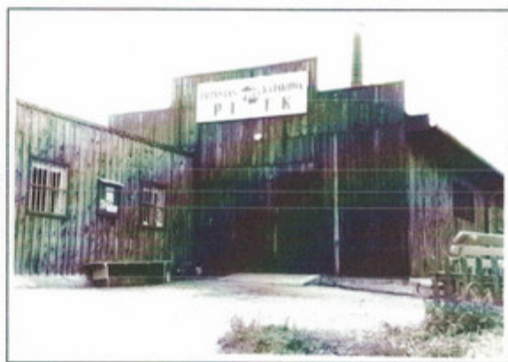
Przystań kajakowa PTTK, ul. Piwna (lata 60.XX w.)